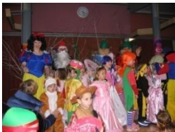
19_ Pustovanje v šmarski osnovni šoli (2013)