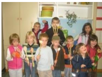
23_Izdelovanje čarobnih palic (2008)

Vrsto let izvajamo ustvarjalne delavnice, katerih namen je spodbujanje otroške ustvarjalnosti in razvijanje ročnih spretnosti. Na delavnicah izdelujemo najrazličnejše stvari iz različnih materialov in večinoma je tema tema vezana na letni čas ali prihajajoče praznike. Namenjene so otrokom najrazličnejših starosti in njihovim staršem.