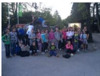
28_Nočni obisk ZOO (2014)