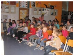
27_ Šolski kino (2012)

V društvu smo se odločili, da združimo zabavno s koristnim ter otrokom ponudimo program filmske kulturne vzgoje. Filmska umetnost nam lahko, poleg sprostitve, ponudi tudi obilico koristnih in poučnih nasvetov. Predvajamo kakovostne filme tuje produkcije, primerne različni starosti otrok.