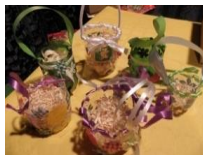
26_ Izdelovanje velikonočnih košaric (2015)