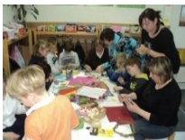
25_ Izdelovanje obešank (2012)