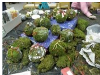
24_Izdelovanje novoletnih bunk (2012)