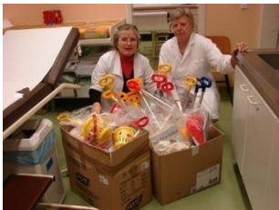
22_Obdaritev bolnih otrok v Zdravstvenem domu Grosuplje (2012)