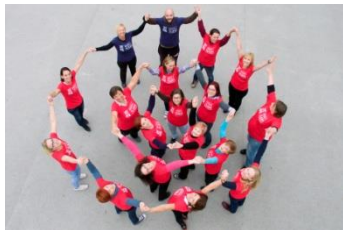
30, 31_Aktivni člani društva (2015)

Zloženska je bila izdana ob 40. obletnici delovanja Društva prijateljev mladine Šmarje - Sap