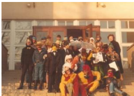
17_ Pustne šeme pred OŠ Šmarje - Sap (1984)