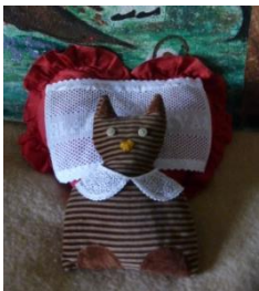
11,12_Ročno šivani igrači (približno 1984)