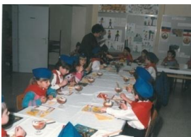
20_Obdaritev prvošolcev (1986)

Zadnji dve leti v sodelovanju s šolo obdarimo devetošolce, ki so imeli vsa leta šolanja odličen uspeh.