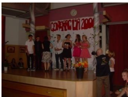
21_ Obdaritev devetošolcev (2015)