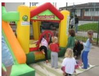
29_Športno dopoldne (2015)