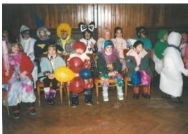
18_ Pustovanje v šmarskem Družbenem domu (1996)